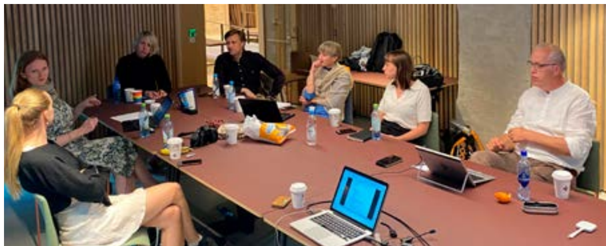
Styremøtet 25. juni i Pressens hus.