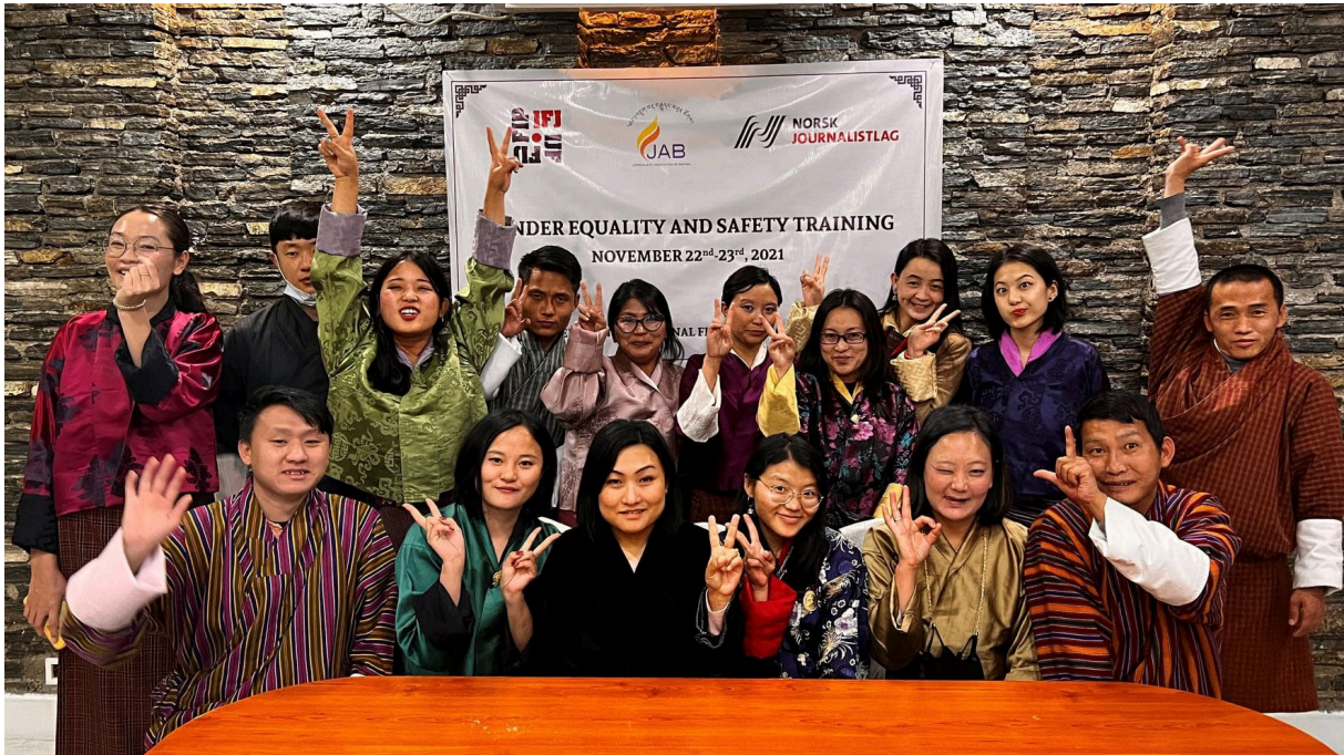
SIKKERHETSKURS: Fornøyde deltakere under et av kursene i regi av blant andre NJ.

ikke minst gjennom bidrag fra medlemmene direkte til NUJU og deres oppbygging og drift av seks solidaritetsentre inne i Ukraina.