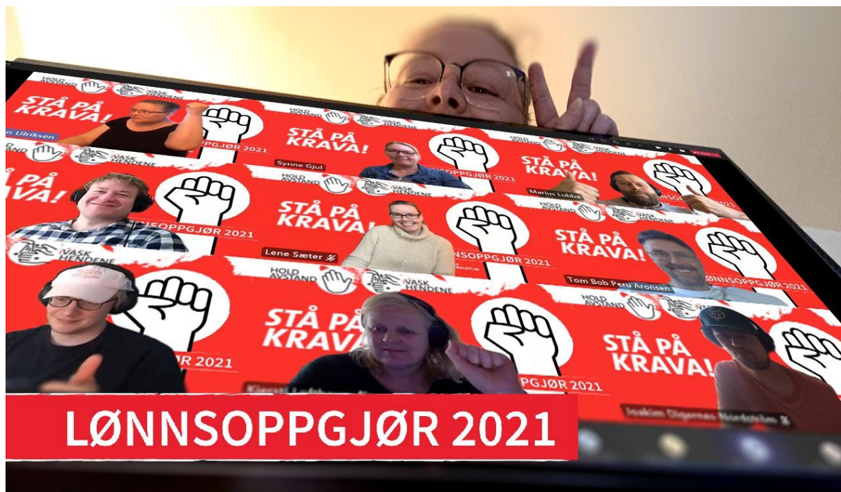
NRK-OPPGJØR: NRKJ Visuell Journalistikk var klare da lønnsoppgjøret i NRK skulle i gang i 2021.

Fast lønn økes med 3,8 prosent. Alle ulempetillegg økes med 3,8 prosent. Innføring av et nytt ulempetillegg på 1000 kroner for arbeid før kl. 13 på julaften, nyttårsaften og påskeaften (tillegg etter kl. 13 finnes fra før). Samlet ramme for oppgjøret er beregnet til 3,9 prosent.