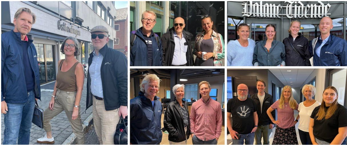
BESØK: Under aksjonsuken fikk 21 redaksjoner besøk, her representert ved noen av dem.