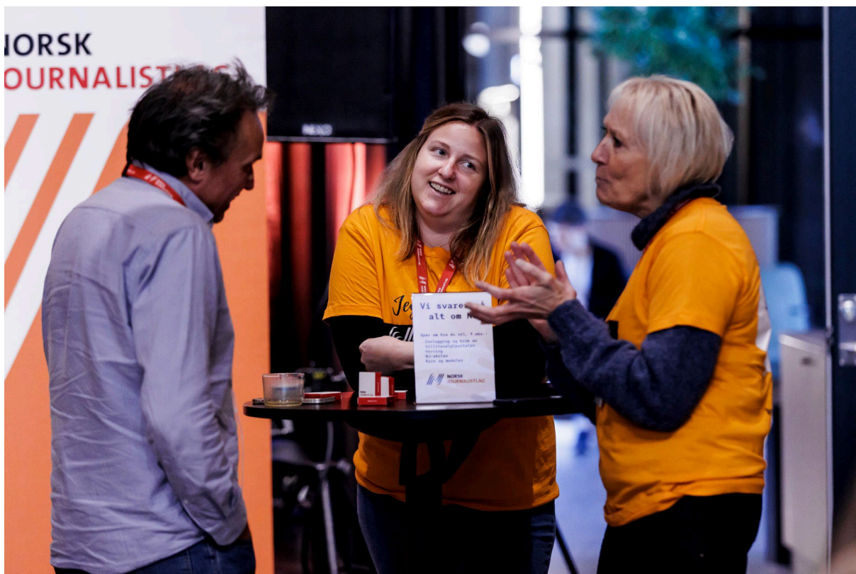
HJELPENDE HÅND: «Spør meg gjerne», sto det på NJ-sekretariatets t-skjorter under Styrkeløft i 2021.