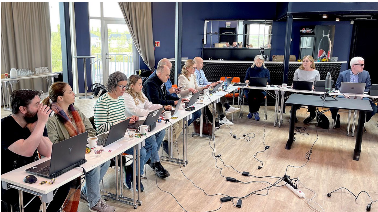
LANGE DAGER: Landsstyrets medlemmer i arbeidet under en av møtedagene i Finnmark.

Vi har til enkelte møter måtte bruke alle på varalista, men det har ikke vært situasjoner der vi ikke har vært mange nok møtende representanter til ikke å være vedtaksføre.