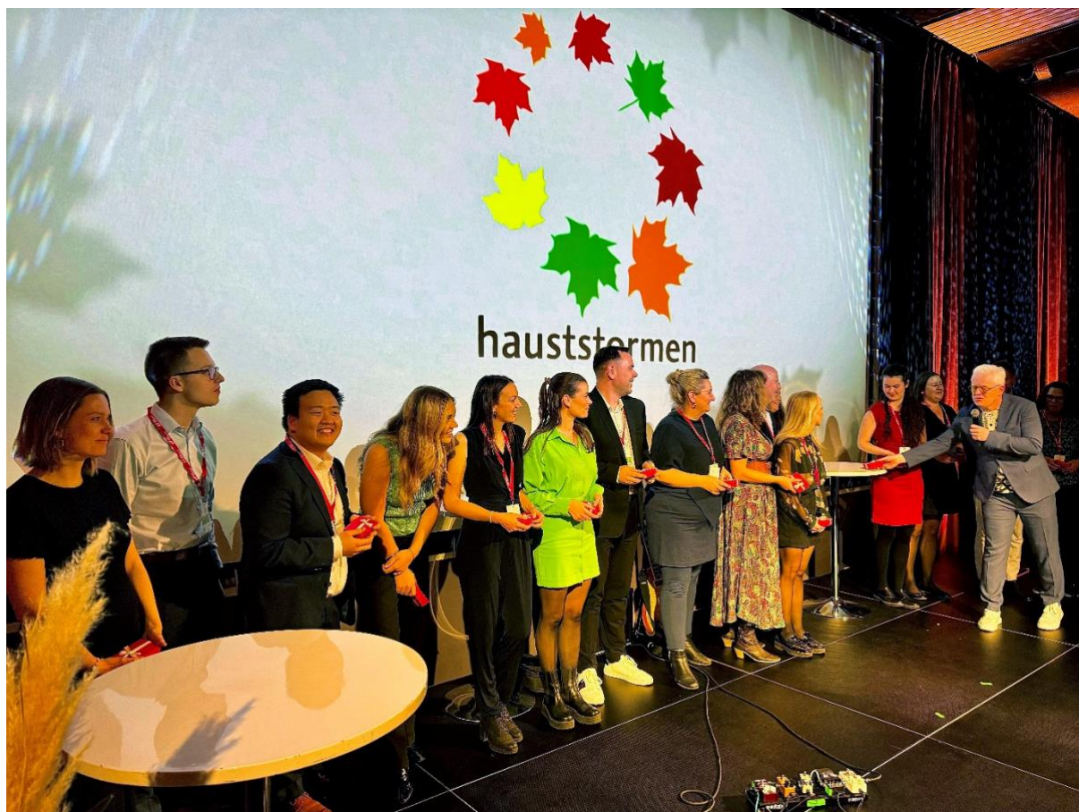
Hauststormen-komiteen takkes etter vel gjennomført konferanse i 2024.

Vestlandskonferansen Hauststormen arrangert i november 2024 med tangering av rekordpåmeldingen og nær 300 deltakere. Hellkonferansen i Trøndelag er 2025s første faglige regional konferanse og arrangeres i februar 2025.