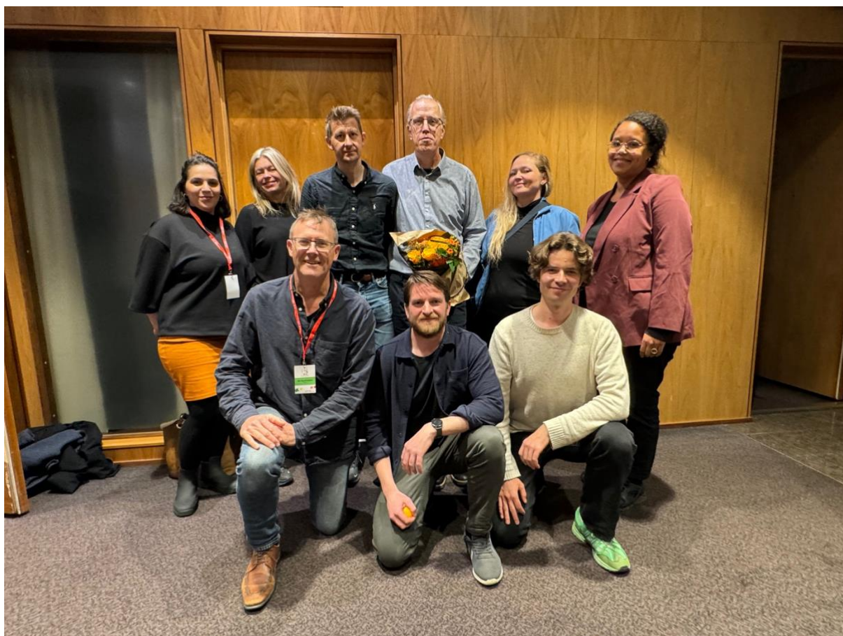
Styret i NJ Frilans, valgt på årsmøtet 2024.

Arbeidet er avhengig av støtte og samarbeidet med moderorganisasjonen. Det har vært avgjørende for NJ Frilans å skape en breiere forståelse for frilansernes utfordringer innenfor hele NJ. NJs landsmøte i 2023 markerte et vendepunkt for frilansernes sak. Her fikk NJ Frilans full støtte fra hele landsmøtet i sitt arbeid for å etablere kollektive avtaler for frilansere. Dette var en historisk seier som ga fornyet håp og energi til kampen for bedre vilkår. Dessverre har vi i 2025 ennå ikke sett de konkrete resultatene av denne støtten i form av faktiske kollektive avtaler, noe som understreker kompleksiteten og de vedvarende utfordringene i dette arbeidet.