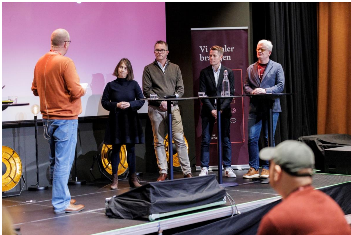
Fra debatt om mangfold på Styrkeløft 2024.

NJ gjennomfører omtrent hvert tiår en større arbeidsmiljøundersøkelse, som går ut til samtlige av våre medlemmer. Undersøkelsen ble denne gangen sendt ut høsten 2022. For første gang var det mulig å splitte opp svarene som omhandlet omfanget av trakassering, trusler og vold på minoritetsgrupper. Undersøkelsen dokumenterte at skeive, etniske minoriteter og medlemmer med funksjonsnedsettelse i større grad enn andre opplever trusler, trakassering og i verste fall vold. Dette er et viktig bidrag i kartlegging av arbeidssituasjonen til de gruppene vi definerer som minoriteter, og som utgjør det mangfoldet NJ har sagt vi ønsker. Dessverre er omfanget av trusler og trakassering en årsak til minoritetsjournalister søker seg vekk fra synlige posisjoner, og i en del tilfeller forsvinner fra journalistyrket. I forbindelse med Oslo Pride sommeren 2024, publiserte vi derfor en kronikk med tittelen «Skeive journalister trakasseres mer» som adresserte dette problemet.