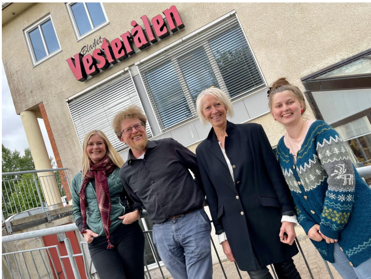
Landsstyret og sekretariatet har vært på mange nyttige og hyggelige besøk hos klubber under Aksjonsuka. Her fra besøket hos Bladet Vesterålen i 2024.

Fordelen med aksjonsuken er at staben i NJ får innsyn i hva som skjer ute i redaksjonene. Fordelen for våre tillitsvalgte/klubbene er tilbudet om bistand her og nå. Og spennet er stort på hva slags saker og problemstillinger som tas opp. Samtidig som de tillitsvalgte blir kjent med NJs stab, får de en konkret medarbeider å forholde seg til i bakkant. På den måten blir også terskelen for å ta kontakt med oss lavere.