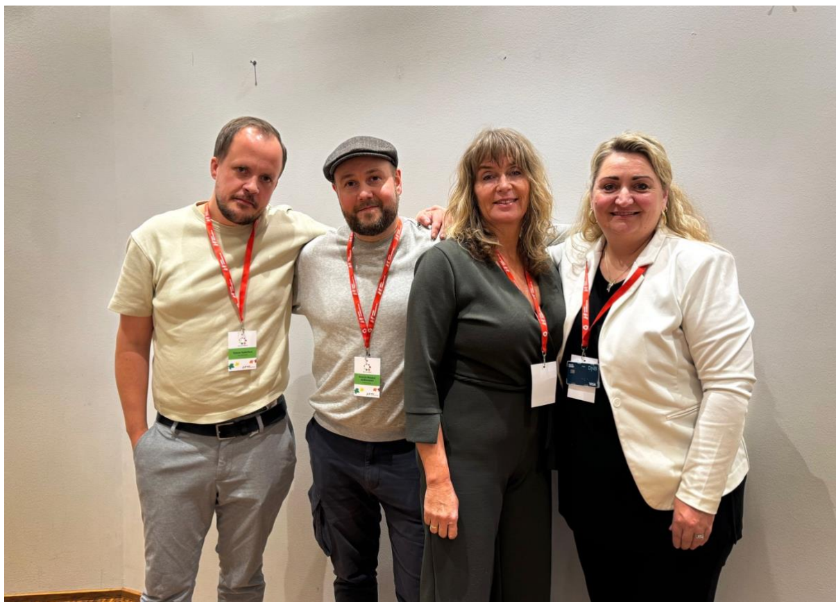
Styret i NJ Haugesund valgt på årsmøtet i 2024.

Sommarfilmfesten blei arrangert 16. august. Då møttest 24 medlemmer til filmvising og middag i Haugesund. Filmen som blei vist handla om ein journalist som stod midt i ein internasjonal krise.