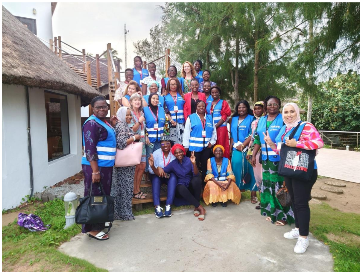
Kursledere fra 17 afrikanske land deltok på møtet i Elfenbenskysten. Alle har fått NJs populære pressevester.