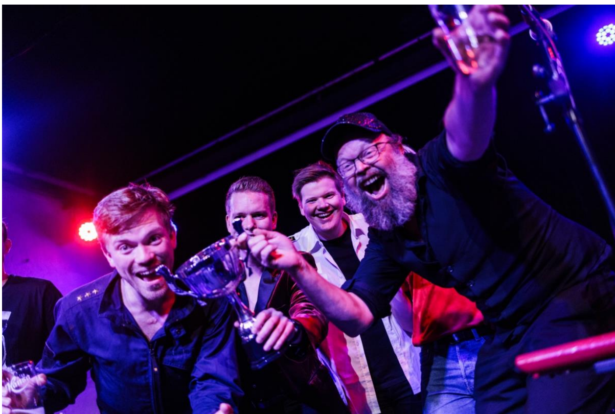
Vinner av den aller første mediefestivalen: Døgnåpent (VG/Dagbladet).

NJ Oslo samarbeider godt med studentlaget og har fleire arrangement retta mot unge vikarar. Vi har invitert til pizza og debatt om framtidens arbeidsmarknad, innføring i rettigheter, inspirasjon frå dei som har fått fast jobb, samt sommarvikartreff.