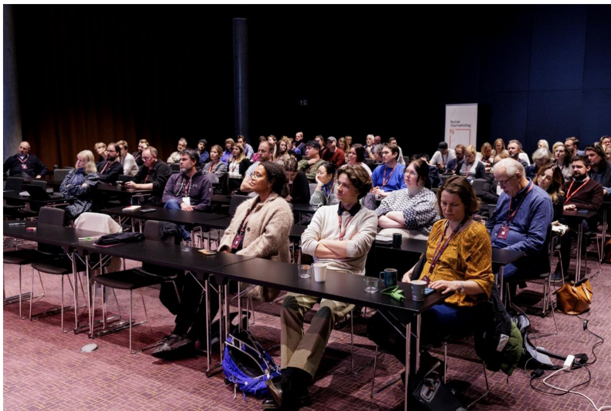
Styrkeløft 2024 samlet over 100 engasjerte tillitsvalgte.

Motimate - ny kursplattform: Motimate er for NJ en ny kursplattform. Den vil bli rullet ut i begynnelsen av 2025 og primært til våre klubbledere. Senere kan andre brukergrupper i NJ inkluderes. Med Motimate blir kursinnhold og nyttig kompetanse tilgjengelig døgnet rundt, både på web og mobil. Innholdsporteføljen av kurs vil kontinuerlig utvikles og egner seg godt til organisering i moduler. I første fase er det kurs rettet direkte mot klubbledere og forhandlingsutvalg som har prioritet. Etter hvert som video og lyd-materiale blir tilgjengelig, kan dette legges inn i de ulike kursene i Motimate.