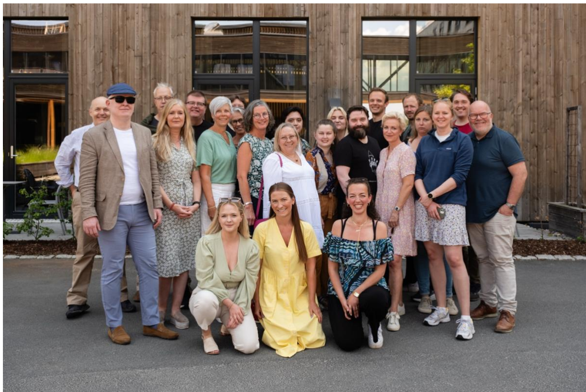
Landsstyret fotografert under styreseminar våren 2023.

Landsstyrets sammensetning har vært stabil gjennom hele perioden, med de første utskiftningene nå først på tampen av perioden som følge av bytte av jobb.