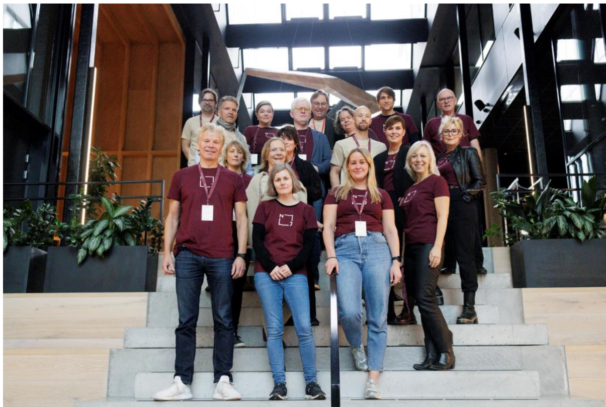
Ansatte i sekretariatet fotografert på Styrkeløft 2024.

NJ teller medlemmer ved årsskiftet hvert år.