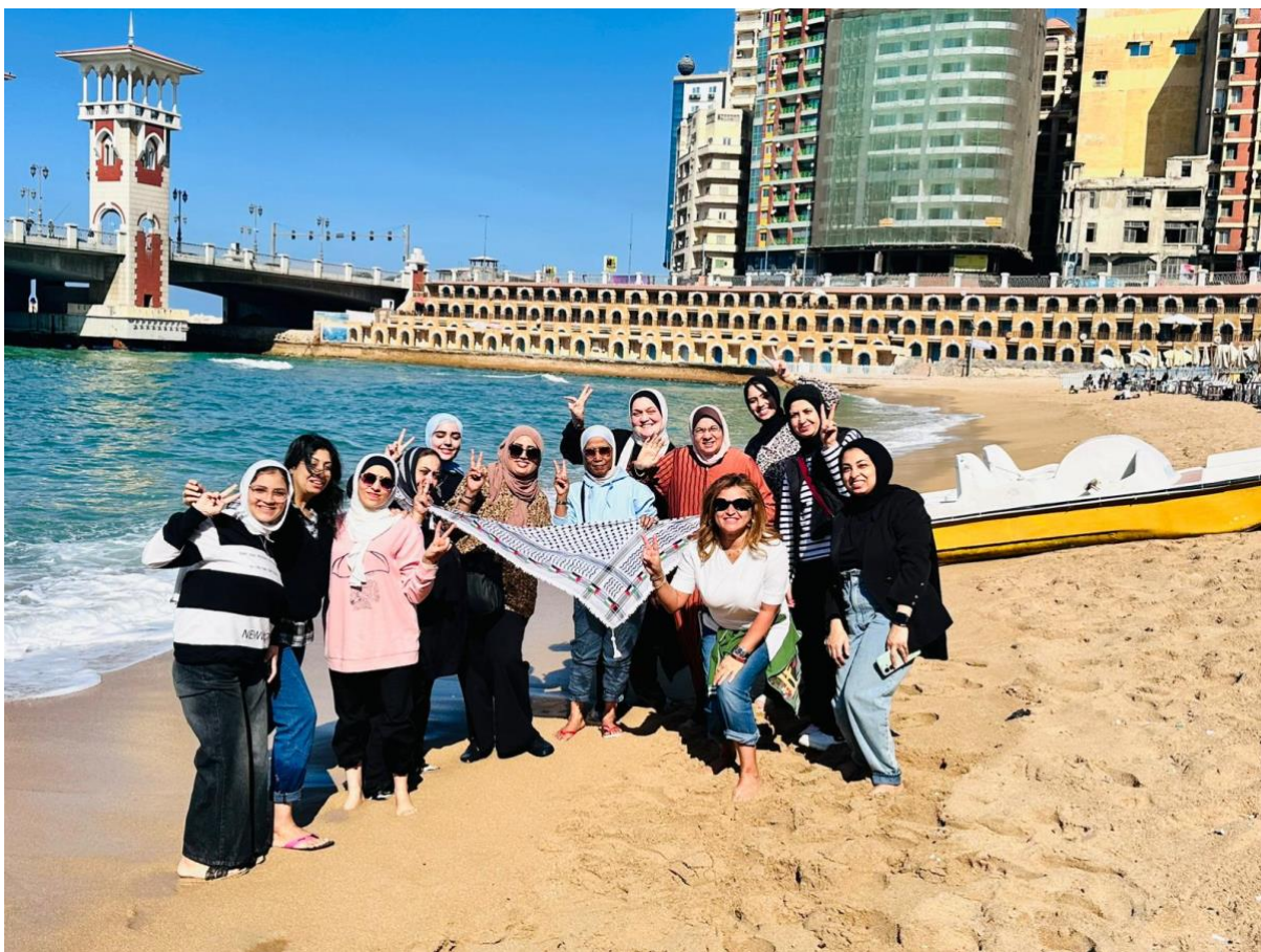
Solidaritetsfondet og NJs kursledere i Kairo tok i 2024 en gruppe traumatiserte, kvinnelige eksil-journalister fra Gaza på tur til Alexandria – de følte et sterkt savn av havet.