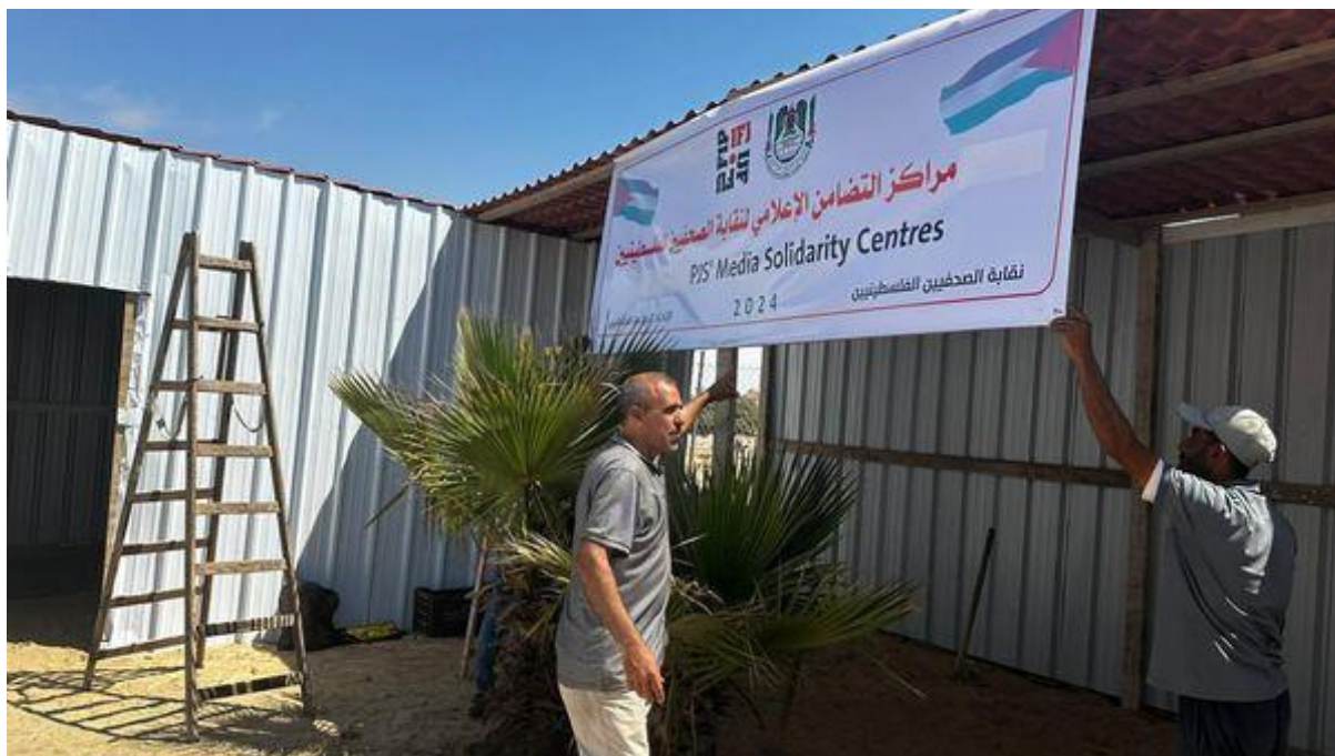
Den NJ-støttede mobile redaksjonen i Gaza ble bygget i juni 2024