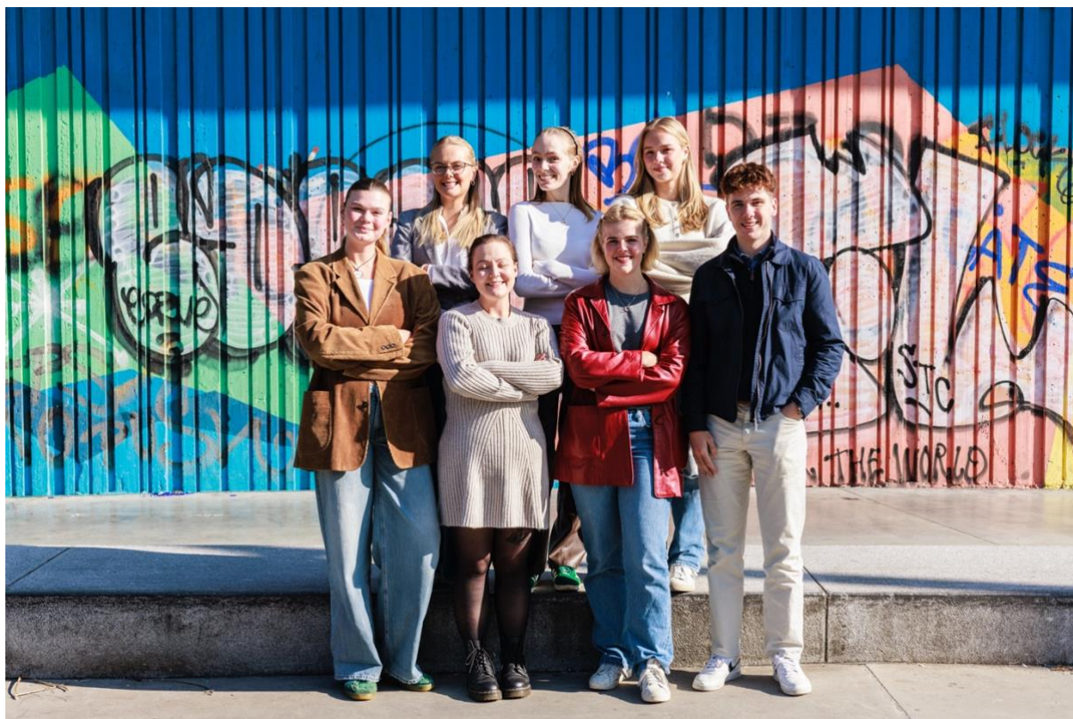
Styret i NJ Student valgt på årsmøtet i 2024.

NJ Student har hatt ivrige og aktive tillitsvalgte i perioden, og har jobbet mye med på verving. Det har gitt resultater i et rekordstort antall studentmedlemmer både i 2023 og 2024. Både styret i NJ