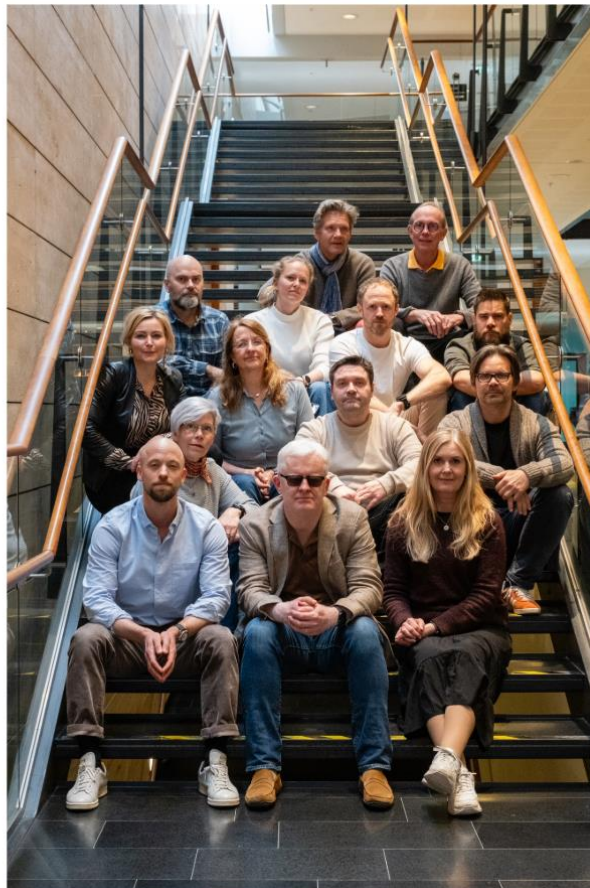
Disse forhandlet lønna i NRK (t.v) og MBL i 2024.